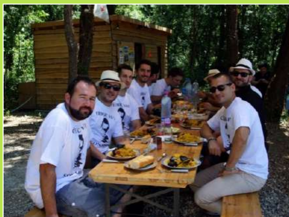
Repas provençale à l'accueil

De la simple randonnée au week-end aventure, nous pouvons organiser une prestation adaptée en fonction de vos envies