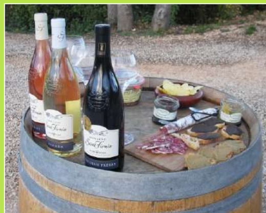
Dégustation de Vins - Tapas