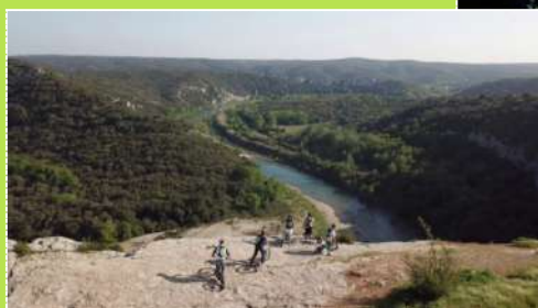
Les Gorges du Gardon

Montez sur un Escoot électrique pour une expérience ludique 100% nature Formule de 1h00 – 2h15 – ½ Journée – Canoë / Etrot ' De 4 à 30 personnes avec en complément des Ebike tout terrain