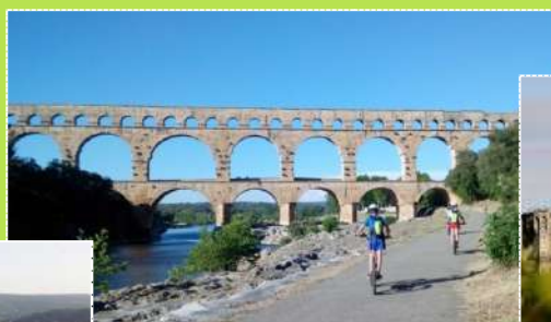
Le Pont du Gard